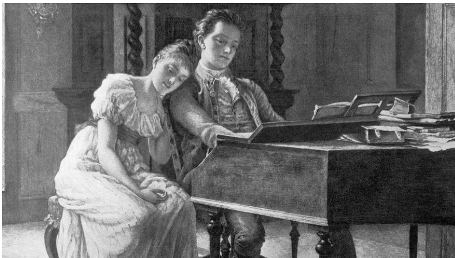
Felix et Fanny Mendelssohn

Maria Anna, dite Nannerl, et Fanny, musiciennes de haut niveau sont également compositrices. Si le catalogue de Felix compte 321 œuvres, celui de Fanny, 460 dont près de 250 lieder dont certains sont parfois publiés sous le nom de son frère, Felix. On croit pouvoir affirmer qu'il en a été de même pour Nannerl. C'est ce à quoi Marie-Paule Belle fait allusion dans sa chanson de 1973, Wolfgang et moi : Aujourd'hui sous son nom, mes œuvres sont jouées... je n'aurais pas dû le laisser signer « Wolfgang » .